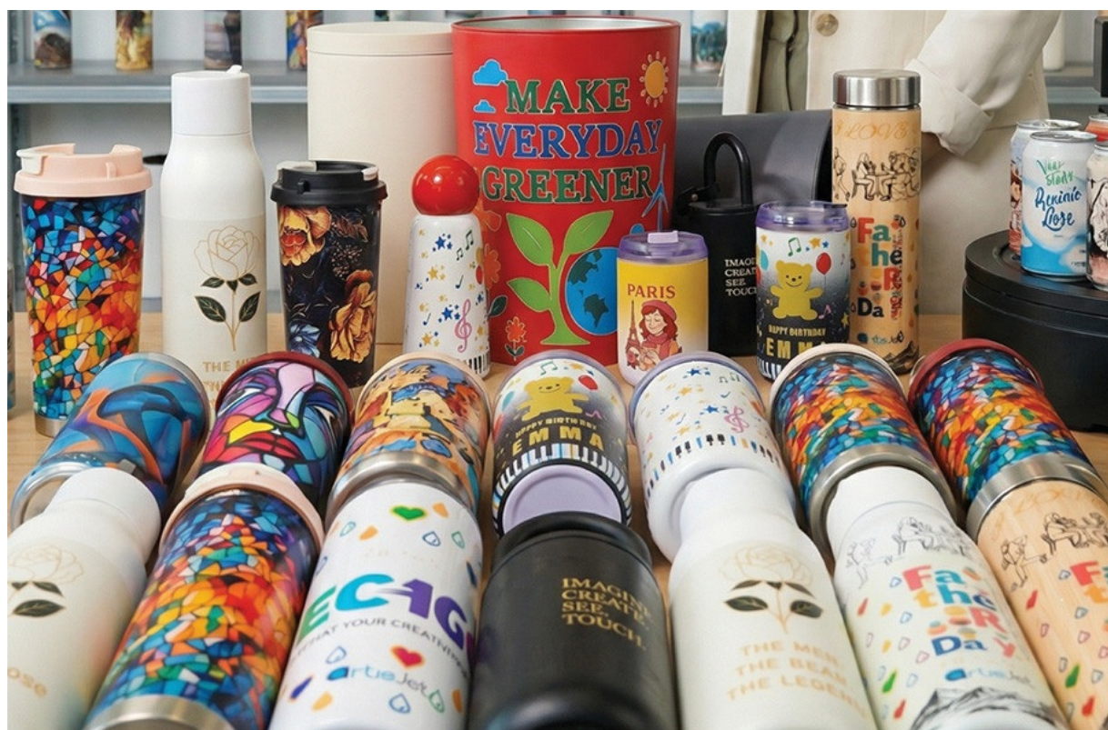
FREEBIRD – technologia dająca prawdziwą wolność twórczą

ArtisJet Trust z technologią FREEBIRD to przemysłowej klasy drukarka UV LED zaprojektowana dla firm chcących budować rozpoznawalność swojej marki poprzez najwyższej jakości personalizację produktów. To urządzenie do druku bezpośredniego, które dzięki innowacyjnemu układowi lamp, precyzyjnemu systemowi prowadzenia stołu i kompatybilności z szeroką gamą materiałów pozwala realizować zarówno projekty indywidualne, jak i produkcję seryjną. Jeśli potrzebujesz drukarki, która drukuje tam, gdzie inne zawodzą – to właśnie artisJet Trust jest idealna dla Ciebie!